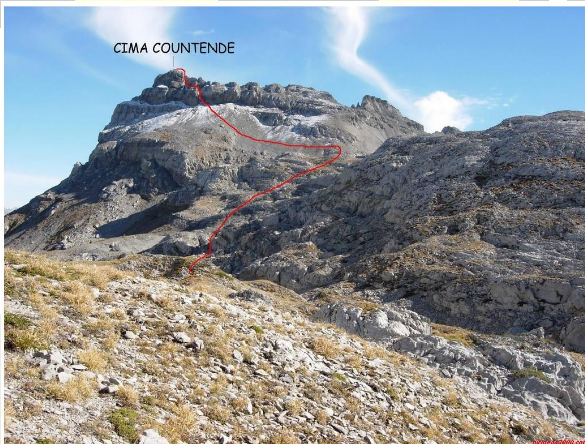
Vista de Countende desde Col d'Anie